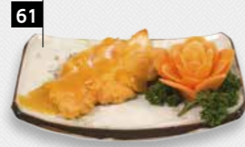
61 ORANGE CHICKEN