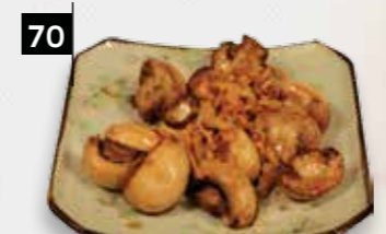
70 GEBAKKEN CHAMPIGNONS