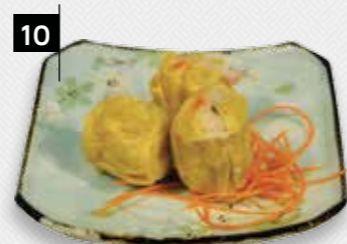
10 SIEUW MAI