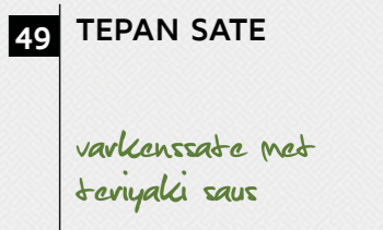
49 TEPAN SATE