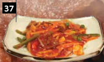
OSSENHAAS IN CHINESE STIJL