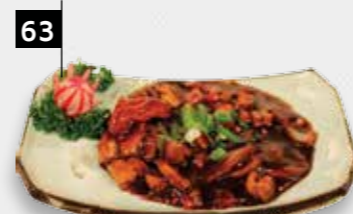
63 MONKOE CHAAI

Deze pagina is een aanrader voor groenteliefhebbers!