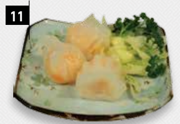
11 HA KAU

12 GARNALEN TODMAN Een garnalen tosti om bij weg te dromen!