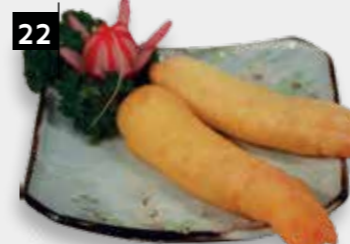
22 GEFRIT. GARNALEN

EEN PAAR HEERLIJKE KIPPENVLEUGELS OM VAN TE GENIETEN!!!!