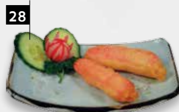
28 GEPAN. KRABSTICK