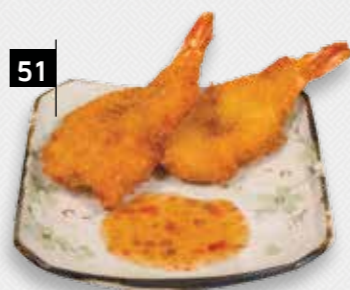
51 GEPAN. GARNALEN