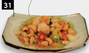
KONG PO HA garnalen met cashewnoten