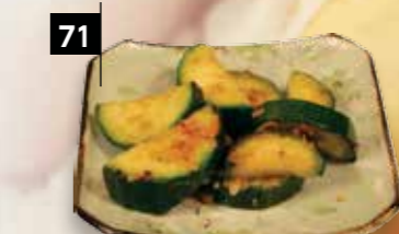
71 GEBAKKEN COURGETTE