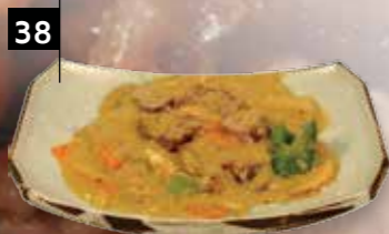
OSSENHAAS IN KERRIESAUS