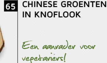
65 CHINESE GROENTEN IN KNOFLOOK Een aanrader voor vegetariërs!