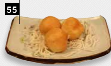
55 KOE LOE YUK varkensvlees

Deze peyvareerde varkenvlees is vol van smaak