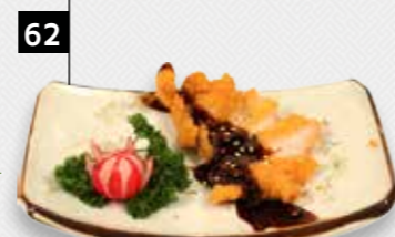
62 TERIYAKI CHICKEN