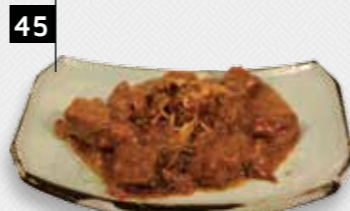
RUNDVLEES IN KERRIESAUS