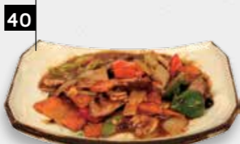
OSSENHAAS ZWARTE BONENSAUS