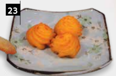
23 GEBAK. AARDAPPELEN