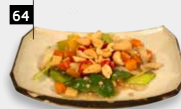
64 KONG PO CHAAI div. groenten, cashewnoten in pikante saus