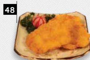
48 GEPAN. TONGFILET