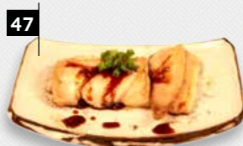
47 TEPAN WITVIS