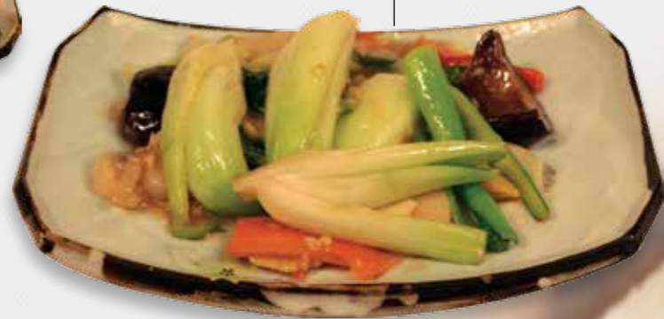
68 GADO GADO