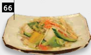
66 TJAP TJOY