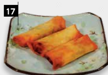
17 MINI LOEMPIA