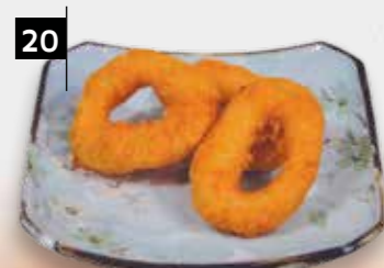
20 GEFRITUURDE INKTVIS