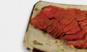
59 HEUNG SOU AP Pekingend in een krokant jasje