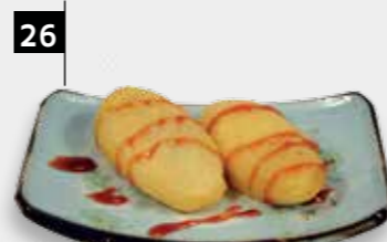
26 PISANG GORENG