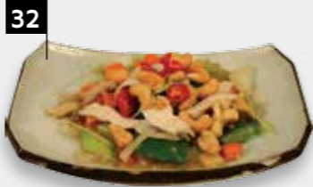
KONG PO KAI kipfilet met cashewnoten