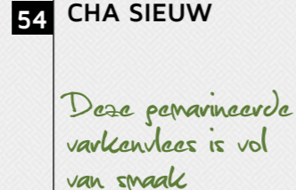
54 CHA SIEUW

Deze peyvareerde varkenvlees is vol van smaak