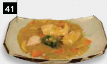
KIPFILET IN KERRIESAUS