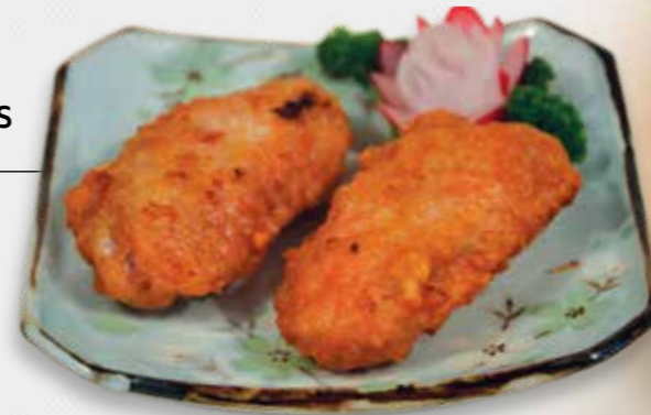
21 GEBAK. KIPPENVLEUGELS

EEN PAAR HEERLIJKE KIPPENVLEUGELS OM VAN TE GENIETEN!!!!