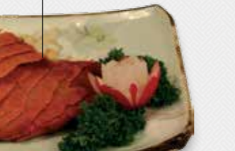
60 AJAM PANGANG