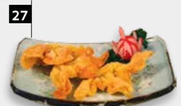
27 PANGSIT GORENG