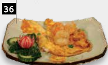
FOE YONG HAI GARNALEN