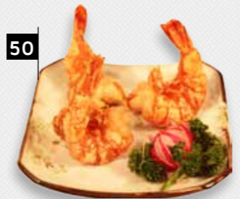
50 TEPAN GARNALEN