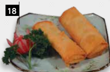
18 THAISE LOEMPIA