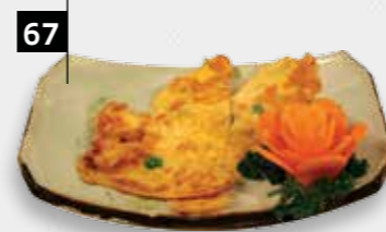
67 FOE YONG HAI