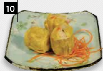
10 SIEUW MAI