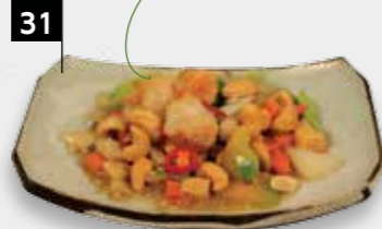
KONG PO HA garnalen met cashewnoten