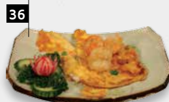
FOE YONG HAI GARNALEN