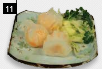
11 HA KAU

12 GARNALEN TODMAN Een garnalen tosti om bij weg te dromen!