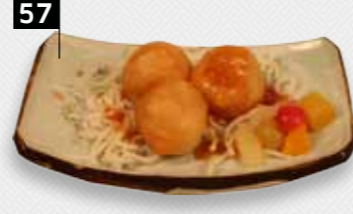
KOE LOE HA garnalen