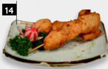
14 SATE AJAM