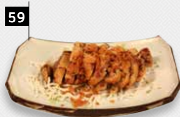
HEUNG SOU AP Pekingend in een krokant jasje