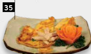
FOE YONG HAI KIP