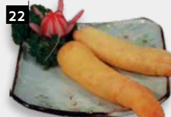
22 GEFRIT. GARNALEN

EEN PAAR HEERLIJKE KIPPENVLEUGELS OM VAN TE GENIETEN!!!!