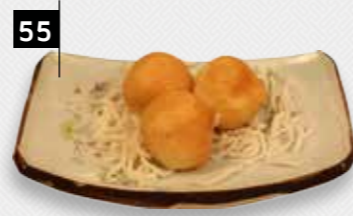
KOE LOE YUK varkensvlees

Deze pevareerde varkenvlees is vol van smaak