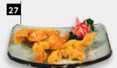
27 PANGSIT GORENG