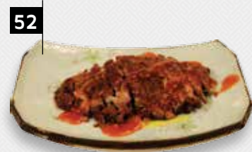
BABI PANGANG SPECIAAL