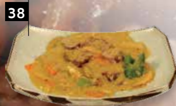
OSSENHAAS IN KERRIESAUS