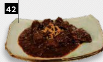
RUNDVLEES IN KETJAPSAUS