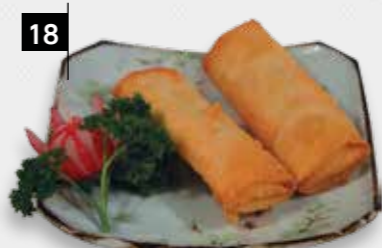
18 THAISE LOEMPIA