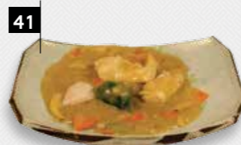
KIPFILET IN KERRIESAUS