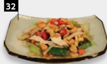
KONG PO KAI kipfilet met cashewnoten