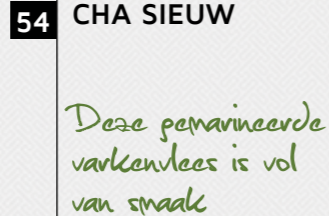
54 CHA SIEUW

Deze pevareerde varkenvlees is vol van smaak