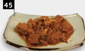
RUNDVLEES IN KERRIESAUS