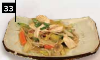
TJAP TJOY KIP