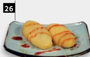
26 PISANG GORENG