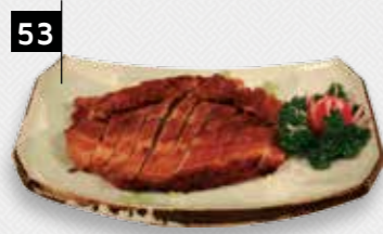
BABI PANGANG SPEK