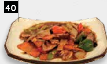
OSSENHAAS ZWARTE BONENSAUS