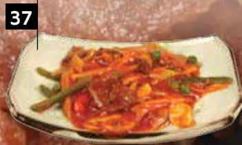
OSSENHAAS IN CHINESE STIJL