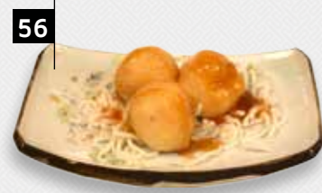
KOE LOE KAI kippenvlees