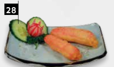
28 GEPAN. KRABSTICK