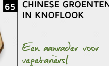
65 CHINESE GROENTEN IN KNOFLOOK