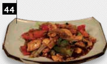
KIPFILET ZWARTE BONENSAUS