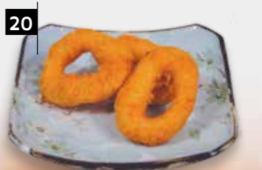
20 GEFRIITUURDE INKTVIS