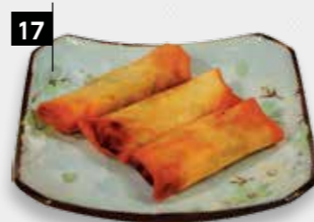
17 MINI LOEMPIA