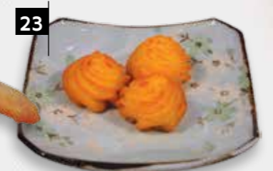
23 GEBAK. AARDAPPELEN