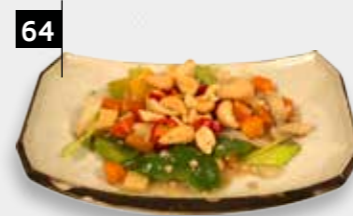
KONG PO CHAAI div. groenten, cashewnoten in pikante saus