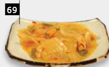
SAJOER indische groenten