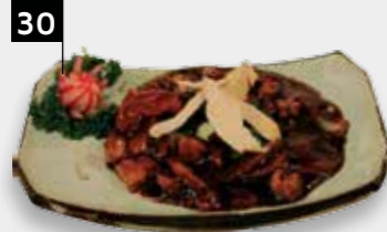
MONKOE KAI kipfilet in pikante saus