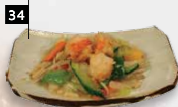
TJAP TJOY GARNALEN